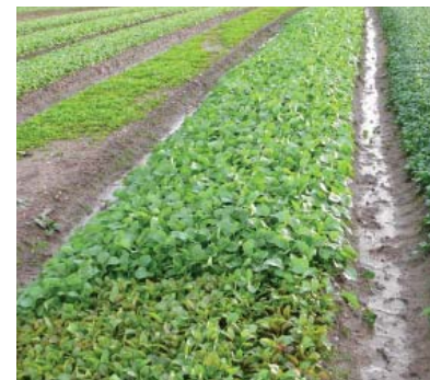
Testproduktion af Colza-raps som baby leaf (spæde blade) startede i efteråret 2009.

Raps er således en vidunderplante. Roden er spiselig, idet kålroe er en variant af raps. Hos hvid raps (Colza) er det spiren, kimplanten og bladene, der er velsmagende. Blomsterne er velsmagende både hos gul og hvid raps, og frøenes olie ligger i den ernæringsmæssige topklasse. Olien i den hvide raps har samme gode fedtsyresammensætning som olien i den gule raps, men med en lidt mildere smag på grund af fravær af bitterstoffer (tanniner). Resterne efter oliepresningen, rapsskrå, er et skattet proteinfoder til husdyr. Kun rapsens stængel er uegnet til mad eller foder.