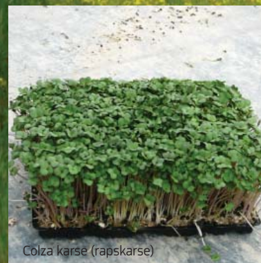
Colza karse (rapskarse)

Den hvide vårrapsort Lysidé omgivet af en alm. gul raps til at opfange skadeinsekter.