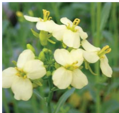
Blomsten af Lysidé er, sammen med gule rapsblomster, et faverigt tilskud til de danske sommersalater.

Den lyse blomsterfarve i sorten Lysidé stammer fra en gammel skotsk foderraps ved navn "Hobson". Foder-raps er en bladrig type af vinterraps, som tidligere blev brugt til kvægfoder i bl.a. Skotland. Gennem en serie traditionelle krydsninger er den lyse blomsterfarve overført til dansk vårraps, og efter 15 års forædling kom den første hvidblomstrede vårrapssort "Lysidé" på markedet i 2008.